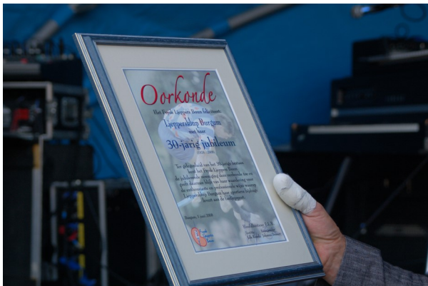
the morning after