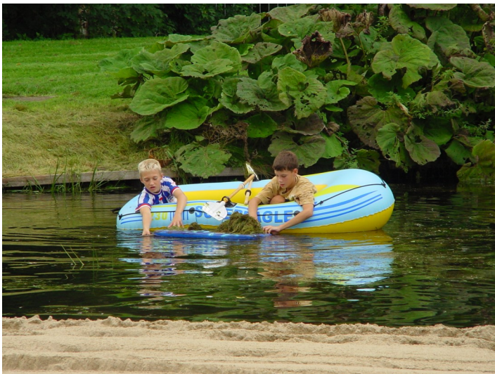
Jeugdige vrijwilligers bezig met het verwijderen van wier in 2006